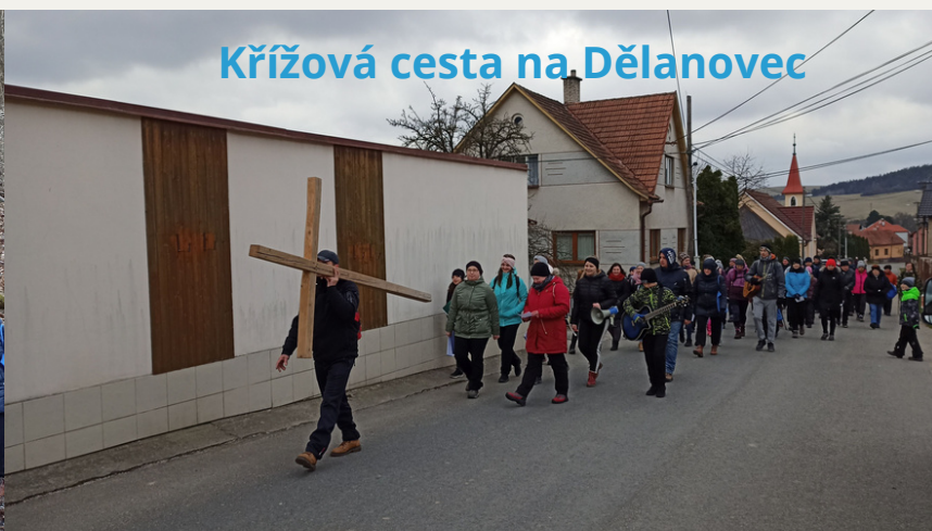
Křížová cesta na Dělanovec