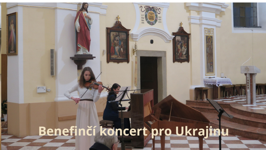
Benefiční koncert pro Ukrajinu