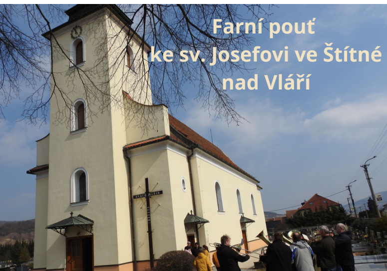
Farní pouť ke sv. Josefovi ve Štítné nad Vláří